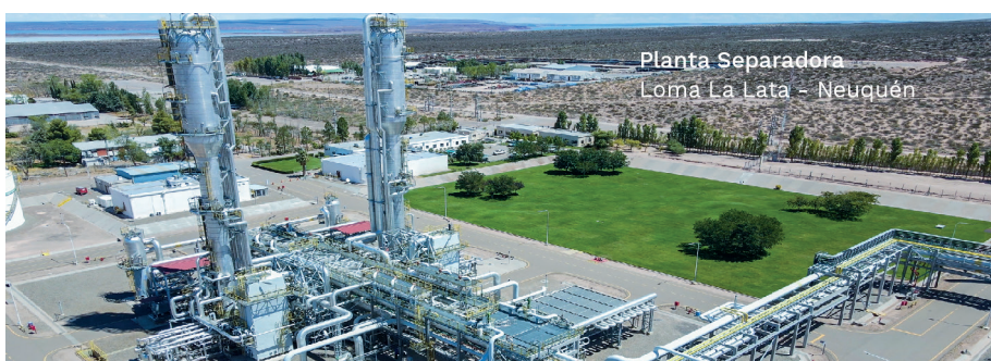
Planta Separadora Loma La Lata - Neuquén

También será clave, añadió, que se garantice el acceso a las divisas y al mercado único y libre de cambio. "Adicionalmente, necesitamos más crudo para procesar localmente, sin sosia-